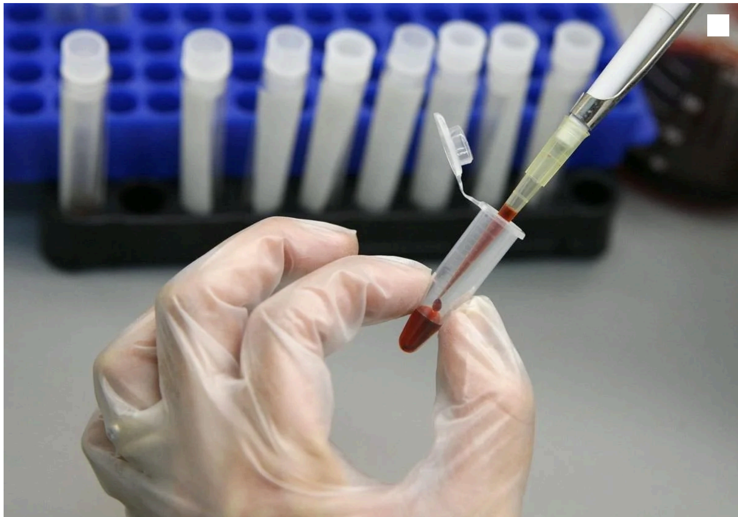
Prueba de sangre para detectar el VIH.

La pérdida de percepción del riesgo entre jóvenes y mayores y el incremento de citas sexuales por las aplicaciones, entre las principales causas